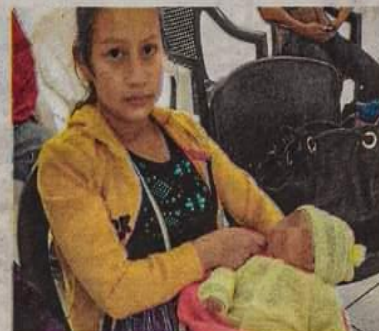
El ser madres muy jóvenes dificulta el desarrollo de las menores.

San Rafael La Independencia, Santa Cruz Barillas, San Pedro Soloma, Santa Eulalia, Nentón y La Democracia.