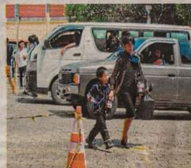
Madre e hijo tienen menos oportunidades a causa de los embarazos a temprana edad.